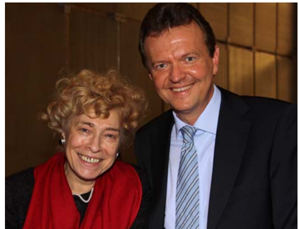
Gesine Schwan besuchte Köln (Bericht auf Seite 3)