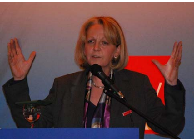
Gastrednerin Hannelore Kraft