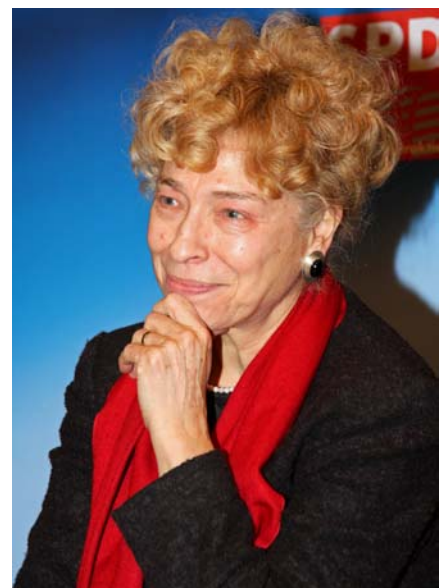
...und aufmerksame Zuhörerin