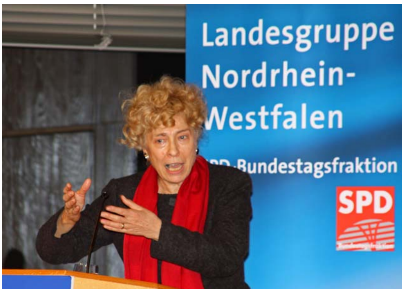
Gesine Schwan als überzeugende Rednerin...